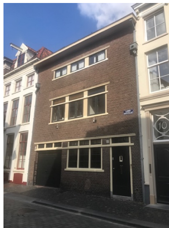
Het pand Lange Hofstraat 12