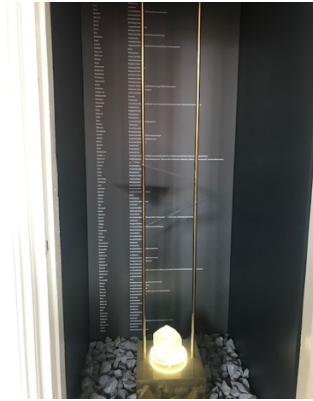
De kast met adressen en namen van weggevoerde gezinnen in het EHC, Deventer

Een directere verbinding met Joodse huizen is nauwelijks denkbaar: iedereen ziet dat de Holocaust niet ver weg was maar 'hier' plaatsvond, 'bij mij om de hoek'. Voor schoolkinderen wordt de foto begeleid door een lespakket over 'Vluchten, vroeger en nu'. Na afloop van de les wordt er een klassiefoto gemaakt van de kinderen die aan de les hebben deelgenomen.